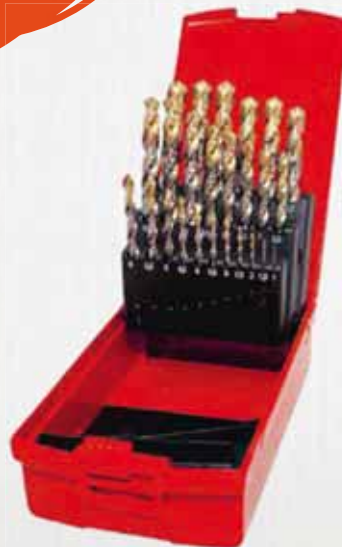
A095 204 1,0-13,0 mm (25 st) Art.nr: 1459-8155

Extra prisvärt A095 201 1,0-10,0 mm (19 st) Art.nr: 1459-8122 459 KR