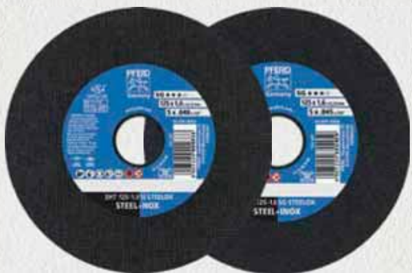
Kapskiva EHT 125-1,0 SG Steelox Art.nr: 1434-4105 Kapskiva EHT 125-1,6 SG Steelox Art.nr: 1434-4113

Kapskiva i prestanda-utförande för stål och rostfritt stål. För kapning av plåt, profiler och homogent material. För kall kapning med hög avverkningsförmåga och bra livslängd. Fri från järn-, klor- och svavelhaltiga tillsatsmaterial. Slipmedel: Aluminiumoxid A. Typ 41: Rak.