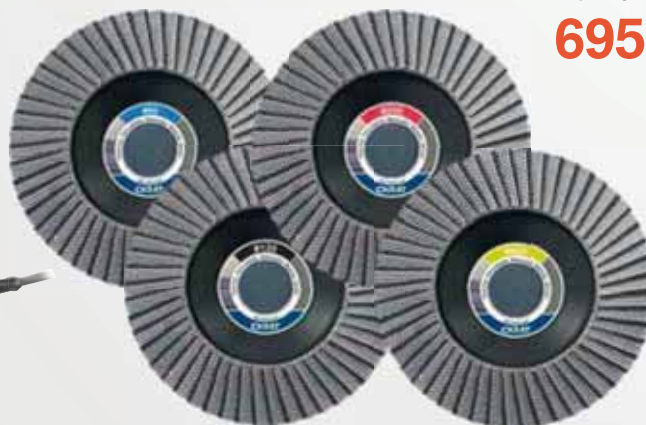
Kornstl: 60 Art.nr: 4041-0011

Diamantslipskiva i form av en lamellrondell. Avsedd för utjämning, slipning, gering och formning av plattor. Kan användas på porslin, keramik, granit, marmor, natursten och glas. Ger en slät finish utan att flisa. Tar bort materialet snabbt. För våt- och torrslipning. Vinklat utförande. Max varvtal 10500 varv/min.