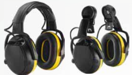
Hjässkäpa Art.nr: 3380-6506

Hörselskydd med aktiva medhörningsmikrofoner. Försedd med nivåberoende mikrofoner med aktiv lyssningsfunktion i varje öronkåpa. Ljudet från högtalarna är begränsat till max 82 dB. Ljudkällor och enheter som musikspelare eller tvåvägsradioapparater kan anslutas via 3,5 mm-ljudingången. Snabb och enkel manövrering. Levereras med 2 st 1,5 V AA batterier. Dämpningsvärde SNR 30 dB. Godkänd/Certifierad enligt EN 352-1:2002 (hjässbygel), EN 352-3:2002 (hjälmkåpa).